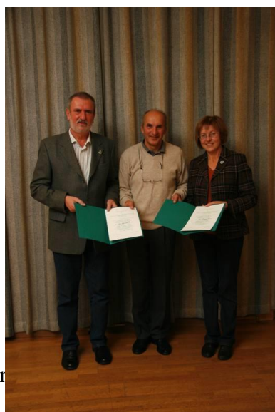
Chor... gesang-Verein Mürzzus...