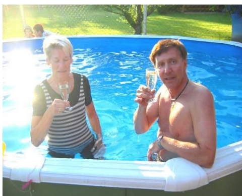
Kühles Nass - außen und

Gemütlich war's im Garten der Skazels. Ein reichliches Buffet und Gutes zu trinken trugen zum launigen Beisammensein auch entsprechend bei. Manche konnten nicht widerstehen und mussten auch das Schwimmbecken benutzen.