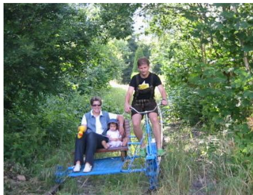
Die Chorleiterin mit Familie auf der Draisine