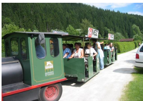
Eine besondere Anreise