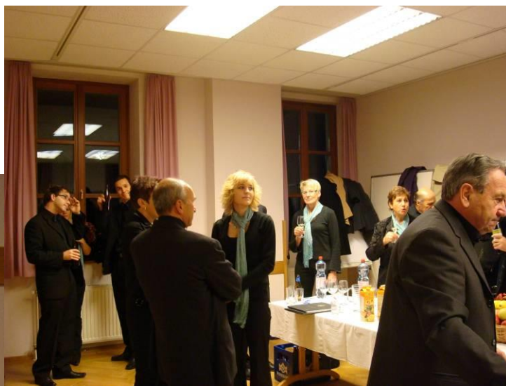
Lustiges Beisammensein vor unserem Auftritt