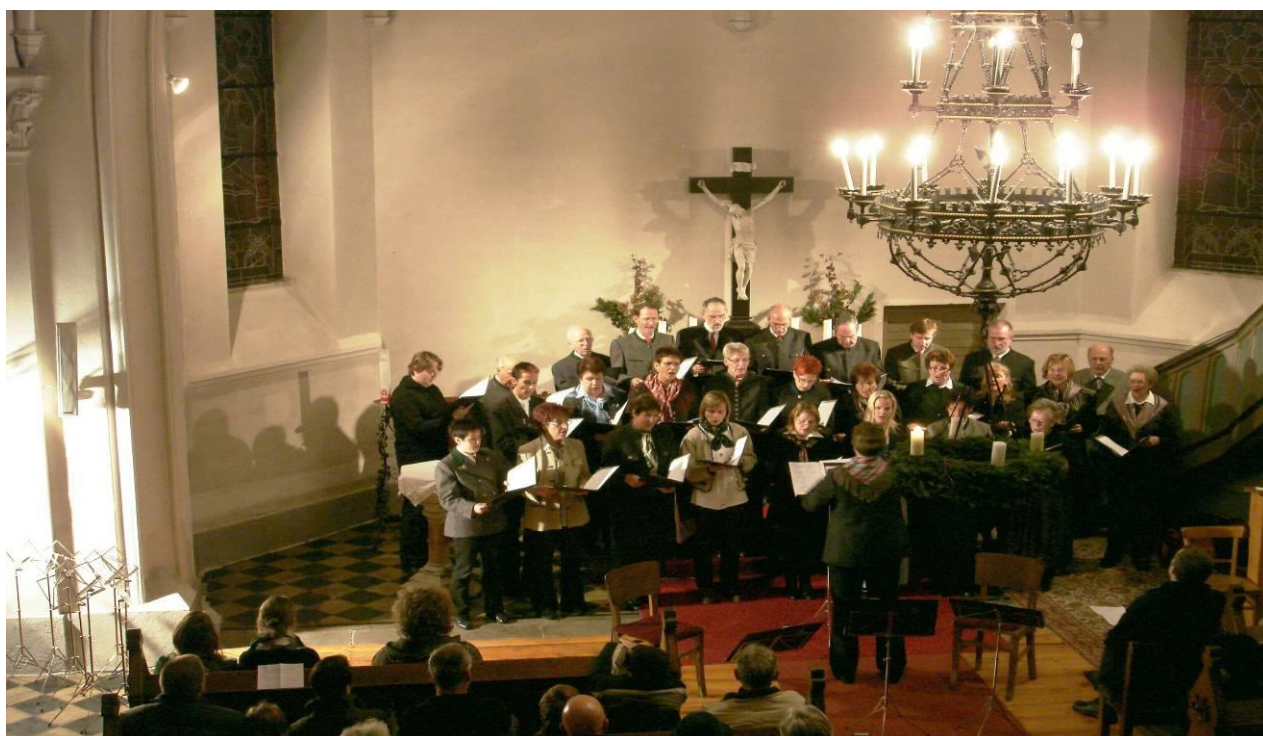
Weihnachtliches Einstimmen in der evangelischen Kirche am ersten Adventsonntag

Wieder fand heuer das traditionelle Adventkonzert am 30.11.2008 in der Heilandskirche in Müzzzuschlag statt. Das Programm war sehr stimmungsvoll und man hatte wirklich das Gefühl, die Adventzeit beginnt. Sämtlichen Mitwirkenden (siehe Programmzettel) ist für die wunderschöne Darbietung zu danken, denn alle haben wesentlich zu einer weihnachtlichen Stimmung beigetragen.