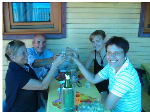
Der "Nach-Nicht-Obmann" mit drei