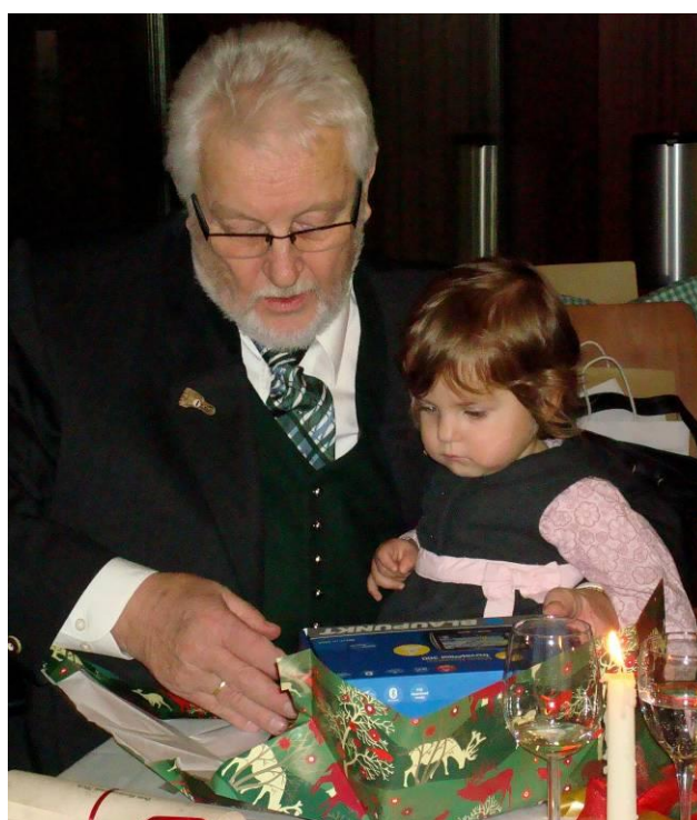
Was in dem Packerl wohl drinnen ist?